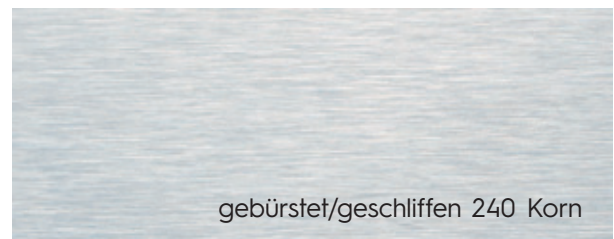
gebürstet/geschliffen 240 Korn

Lieferlängen: 1,50/2,00/2,50 und 3,00 m. Sonderlängen bis max. 3,00 m lieferbar.