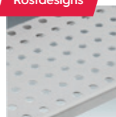
Runde Perforation (Standard)