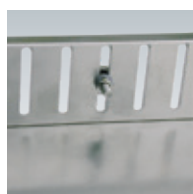
Höhenverstellung Beispiel 1