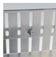
Höhenverstellung Beispiel 2