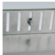
Höhenverstellung Beispiel 1