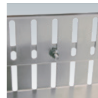
Höhenverstellung Beispiel 2