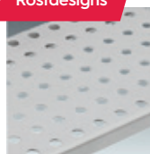
Runde Perforation (Standard)