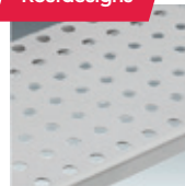
Runde Perforation (Standard)