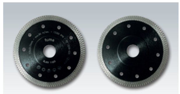
High-End-Diamantscheiben, Ø 125 mm, 1,3 mm dünn, Ornamentsegment, verstärkter Flansch